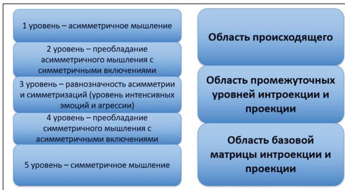
Рис. 2. Три области внутреннего мира человека

Во-первых, с точки зрения проективных процессов, есть более поверхностная область, которую можно назвать областью происходящего . В широком смысле каждое событие подразумевает движение, т. е. некоторое перемещение, физическое или психическое, которое требует времени – изменения. Как известно, происходящее, или изменение (движение), понимается в терминах пространства и времени, а те, в свою очередь, – в терминах асимметричных отношений.