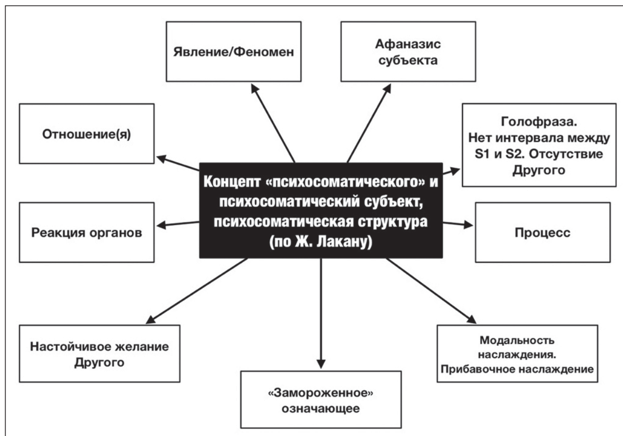
Рис. 1. Концепт «Психосоматического» в семинарах Ж. Лакана

а трансструктурное явление , поскольку мы можем увидеть психосоматический феномен при неврозах и психозах, а также при перверсиях. Это ставит перед нами вопрос: как именно этот феномен расположен по отношению к наслаждению? Например, мы знаем, что при параноидальном психозе существует колебание между телом и Другим. Лакан ссылается на случай Шребера и говорит, что это идеальная иллюстрация: при шизофрении тело в целом охвачено наслаждением. Однако, если речь о клинике психозов, возникают два вопроса: будет ли психосоматический феномен барьером против психоза? будет ли это признаком улучшения, «выздоровления» в случае психоза? (Вспомним примеры, анализируемые Лаканом – Джойс, Беккет.)