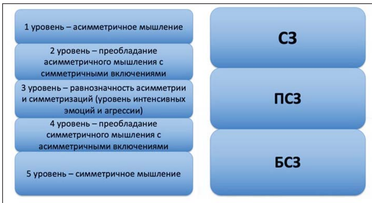
Рис. 1. Пять основных уровней

мы спускаемся на самый нижний уровень, погружаясь в момент засыпания сначала на 4-й, а затем и на 5-й уровни (и глубже). Просыпаясь, мы «выныриваем» выше – сначала в еще некоторую спутанность (присутствие симметризаций на 2-м слое), затем, проснувшись, имея четкие задачи и цели (начать работу, доехать из точки А в точку В и т. п.), переходим на 1-й – очень ясный и логически выверенный. Но – не всегда все идет так гладко... Иногда мы встаем в дурном, часто агрессивном к миру настроении («встать не с той ноги»). А это значит, мы застыли на 3-м уровне, и... «день не задался». Ведь 3-й уровень подразумевает практически равное наличие в мышлении наряду с нормальной (асимметричной) логикой симметричной логики. То есть когда мы чрезмерно склонны обобщать, в одной вещи видеть совсем другую, путать время, не учитывать пространство нахождения и т. п. Обычная ситуация – скажет читатель. Но если это происходит изо дня в день, рождает бесконечные неудачи и часто ведет к симптомам, возникает необходимость в обращении к специалисту. И каково же оно может быть, если посмотреть с точки зрения модели Матте-Бланко и вышеприведенных рассуждений?