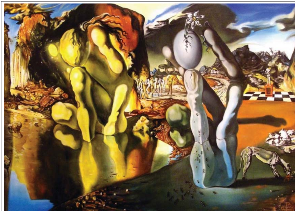
Рисунок 5. «Метаморфозы Нарцисса»

Так Сальвадор Дали обозначил свой подъем на еще более высокий уровень, оторвавшись от иных, «автоматических» сюрреалистов – он глубже их и разум ни при каких обстоятельствах, подобно Бретону, не отключает. Но к его работам необходимо найти ключ. Иначе ему всякий раз придется для объяснения сочинять поэму.