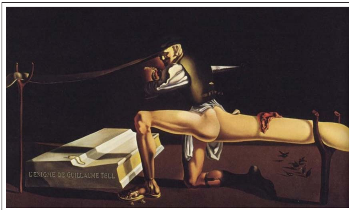
Рисунок 7. «Загадка Вильгельма Телля»

съесть. Крошечный орех у его ноги содержит крошечного ребенка, образ моей жены Галы. Ей постоянно угрожает его нога. Потому что, если нога шевельнется только совсем немного, он может раздавить орех». Однако, как обычно, Дали еще больше усложнил ситуацию, придав Вильгельму Теллю отцу черты Ленина (исключительно для того, чтобы разозлить сюрреалистов). Несмотря на это, картины и биографические свидетельства, предоставленные Дали и другими, определенно указывают на неразрешенный эдипов комплекс.