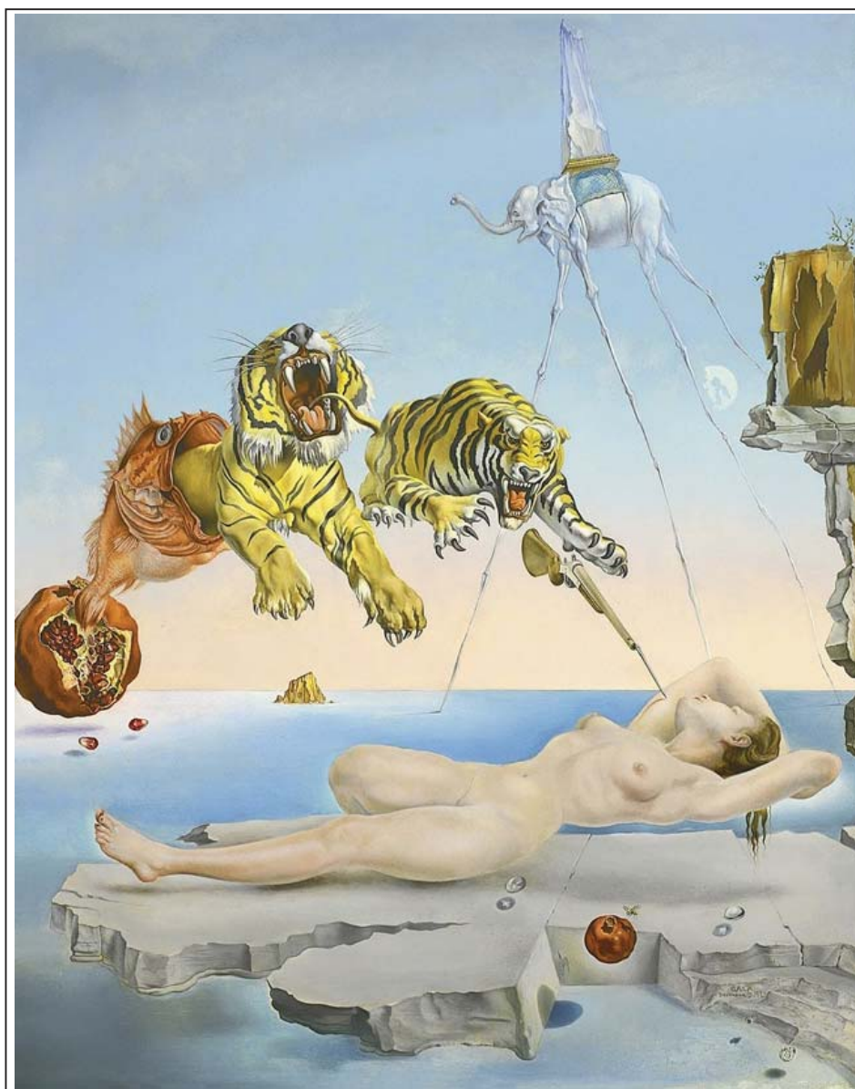
Рисунок 1. «Сон, вызванный полетом пчелы...»

именно благодаря Фрейду. Гранат. Античная и христианская символика связывает данный образ с плодородием и возрождением. По словам самого Дали, из лопнувшего граната возникает вся жизнетворющая биология. Тигры. Полосатые рычащие хищники – это преобразованные сном в образы жужжание и окрас пчелы. Образ, «подсмотренный» Дали на цирковой афише. Ружье со штыком. Трансформированный образ пчелиного жала, разрушения сна, угрозы пробуждения. Фрейд считал это символом мужских гениталий. Страшные сны девушек часто наполнены преследованием мужчины с ножом или ружьем. Рыба. Чешуйчатый покров, вероятно, отражает в снах фасеточные глаза пчелы из реального мира. Слон. Говоря о том, что слон Бернини на заднем плане несет на себеobelisk и атрибуты папы, Дали намекал на сон о похоронах папы римского, увиденный Фрейдом под колокольный звон. Этот случай психиатр