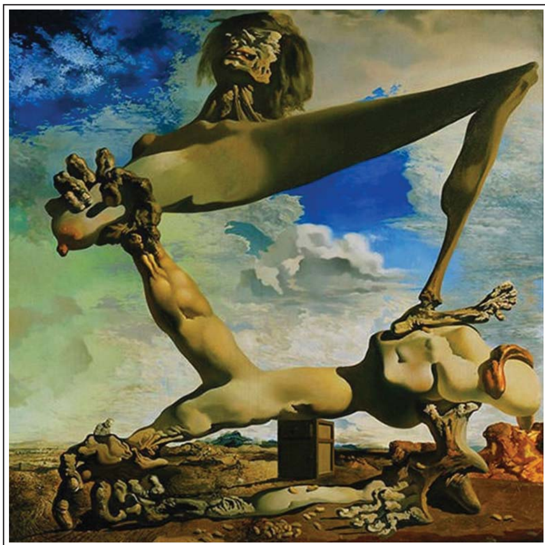
Рисунок 6. «Мягкая конструкция с вареной фасолью»