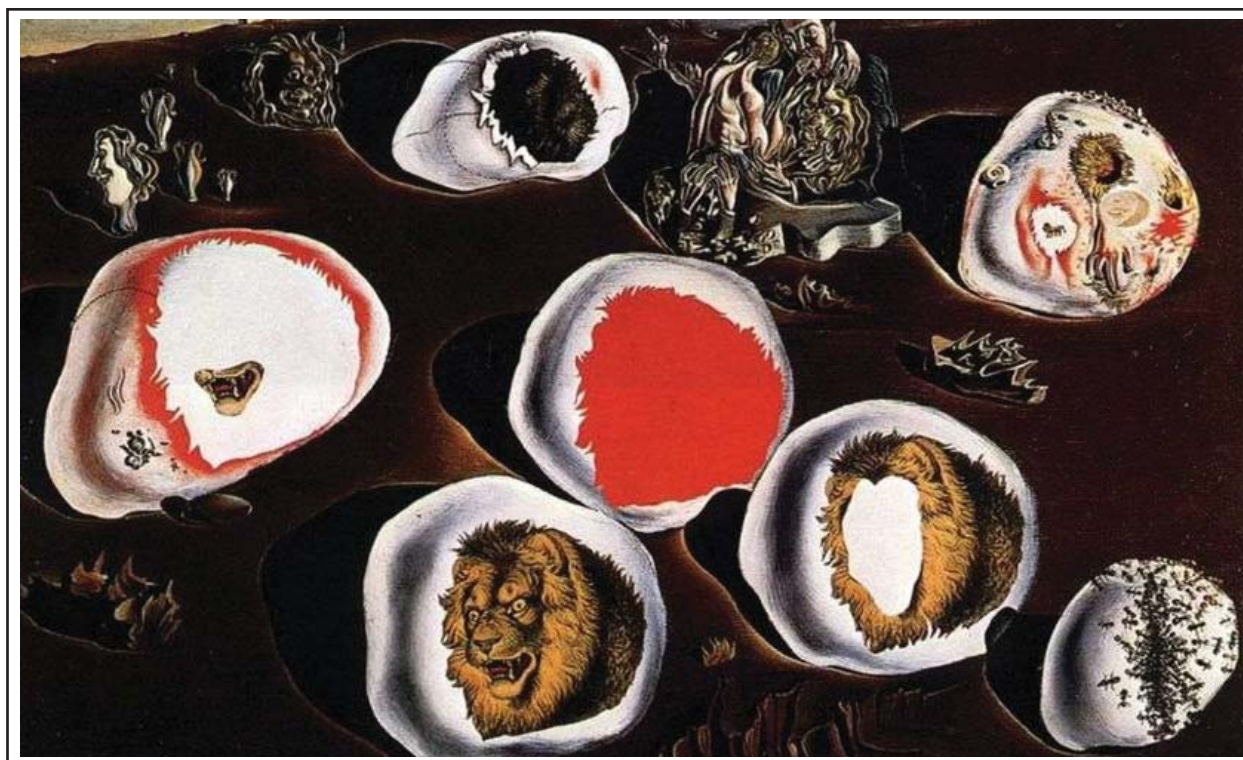
Рисунок 3. «Приспосабливаемость желаний»

Картина Сальвадора Дали «Приспосабливаемость желаний» (рис. 3) – еще один образчик пугающе-притягательного таланта художника. Приверженность к расчленению деталей на мелкие фрагменты здесь ярко прописана в виде вкусного блюда из коконообразных сфер. Сочная подложка с приторно-арбузной гаммой указывает на присутствие чего-то кровавого и зловещего.