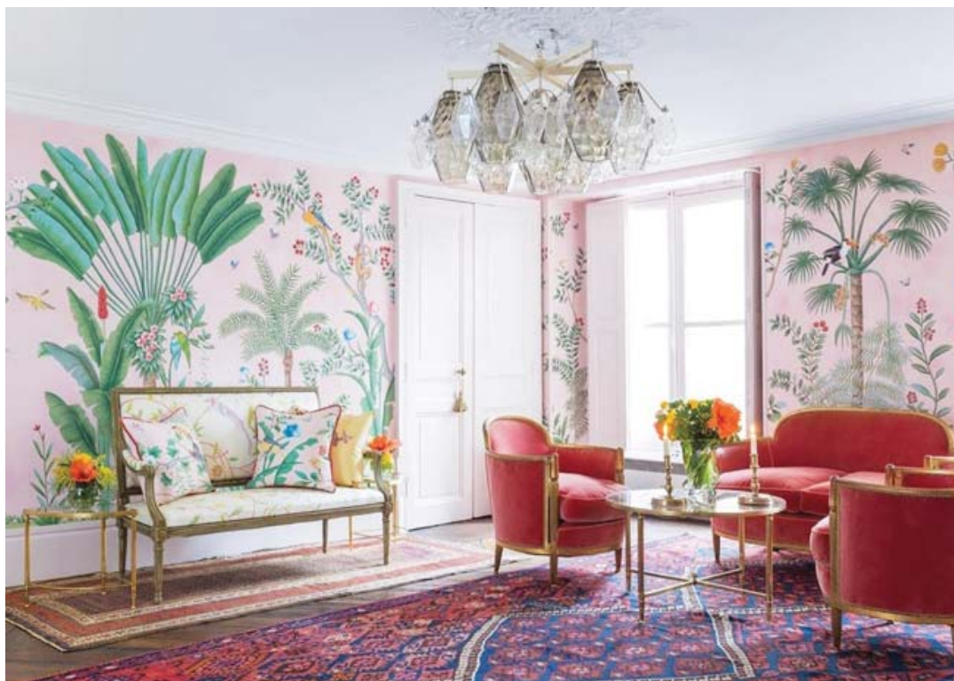
Рис. 6. Бренд de Gournay

Оральность в интерьере проявляется не только в формах, оттенках и приятных тактильных ощущениях, но и в прикладных вопросах. Современные технологии помогут создать идеальный комфорт. С помощью системы «умный дом» можно настроить шумоизоляцию, климат, приточную вентиляцию, степень освещенности. В таком интерьере практичность может уступать место комфорту. В частности, на полу может появиться пушистый ковер, который будет собирать пыль и нуждаться в постоянной чистке, но зато с ним будет теплее и тише. Очень важно для оральных проявлений и то, что предметы вокруг с трудом поддаются разрушению. Детское желание укунить мать и проверить ее на «прочность» может перейти и во взрослую жизнь, где любые поломки и изменения в интерьере будут восприниматься как опасные и враждебные. Тут кстати будет вспомнить сказку о трех поросятах, а затем вспомнить, что в самые тяжелые времена у людей, которые менее всего чувствуют себя в безопасности, жилище больше всего напоминало каменный домик третьего поросенка.