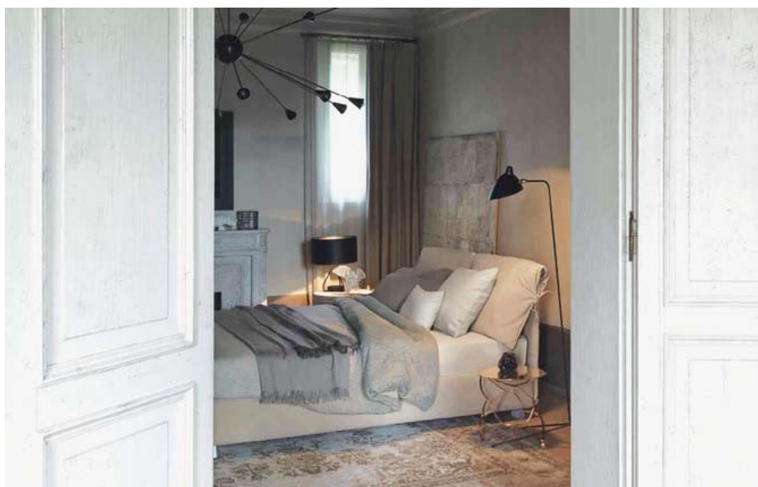
Рис. 2. Вико Маджистретти, Natalie, Flou

Все эти взрослые проявления влечений к жизни и смерти в интерьере, конечно, родом из детства. И замечать их можно гораздо раньше, чем индивид получит свой собственный дом и научится выбирать мебель. Винникотт говорит, что одни люди живут творчески и им это нравится, а другие не могут жить творчески и потому в ценности жизни сомневаются. Он утверждает, что эти различия напрямую связаны «с количеством и качеством опеки и заботы со стороны социального окружения» на ранних этапах жизни (Винникотт, 2017, с. 97). Ребенок заполняет пространство игры продуктами своего творческого воображения (Винникотт, 2017). Физически это пространство можно представить в виде комнаты, а творчество – в виде всего, что ребенок делает в этой комнате. И вот тут стоит