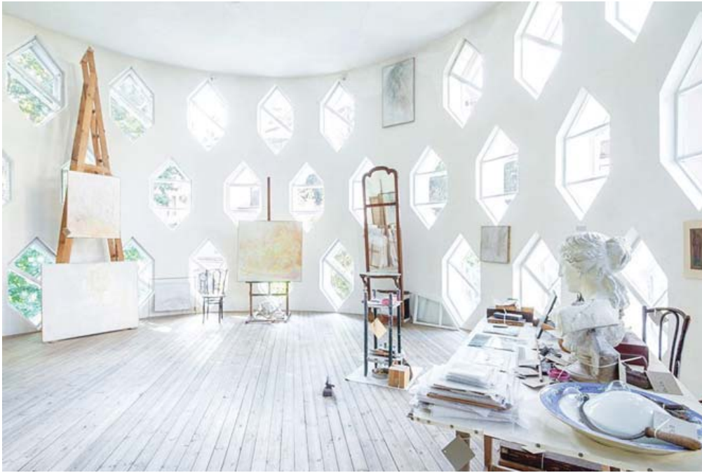
Рис. 3. Дом Константина Мельникова изнутри