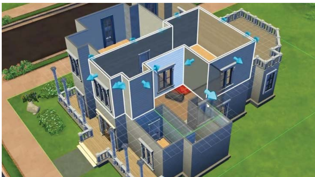
Рис. 5. Sims 4

Это безопасное игровое пространство становится убежищем для бессознательного, если по какой-то причине создание идеальной утробы становится небезопасным мероприятием в реальности. Такое пространство