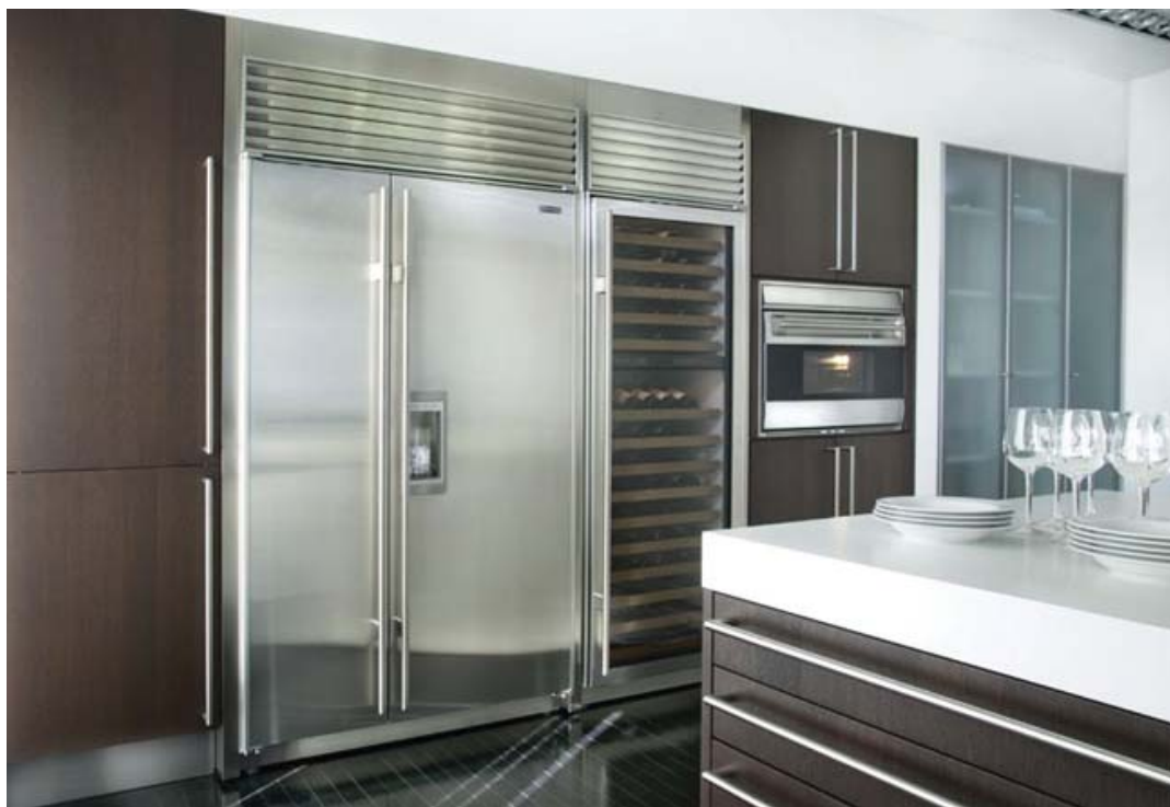
Рис. 7. Кухонная техника Sub-Zero & Wolf

Но настоящий вызов «правильному» аккуратненькому интерьеру и современной степенной кухне – это люксовый бренд кухонной техники Sub-Zero & Wolf (см. рис. 7 ), воспевающий демонстрационную анальность. Основатель компании и изобретатель современного холодильника Вести Бакке искал возможность хранить инсулин для своего сына, а для этого нужна была температура ниже 18 градусов по Цельсию или ниже нуля по Фаренгейту. Отсюда и название, которое дословно переводится как «ниже нуля». Эта профессиональная кухонная техника стоит баснословных денег, имеет гигантские размеры, стоит на кухнях в самых дорогих интерьерах у аристократов и знаменитостей и при этом выглядит довольно устрашающе. Грубые формы, резкие черты, малопривлекательный металл, массивная фурнитура – все это наводит на мысли об огромной кухне ресторана или как минимум чьего-то родового поместья, где для кухни выделяют целый подвал.