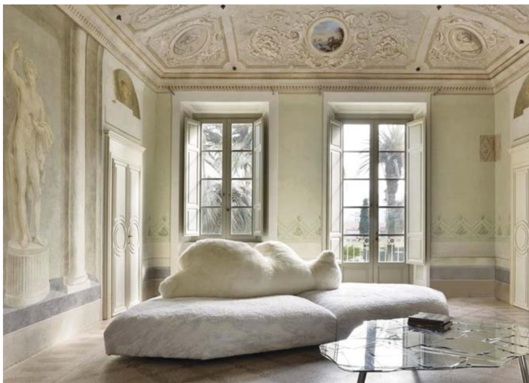
Рис. 1. Франческо Бинфаре, Pack , Edra

Говоря об ощупывании, мы должны упомянуть, что некоторые участки кожи особенно остро реагируют на прикосновение, и особое влияние имеют температурные раздражения. Фрейд говорит, что, зная это, мы поймем терапевтическое действие теплых ванн (Фрейд, 2018а). И действительно, тепло, особенно от прикосновения воды, действует на нас расслабляюще. Ванна, полная воды, – это первая и главная отсылка к тем ощущениям,