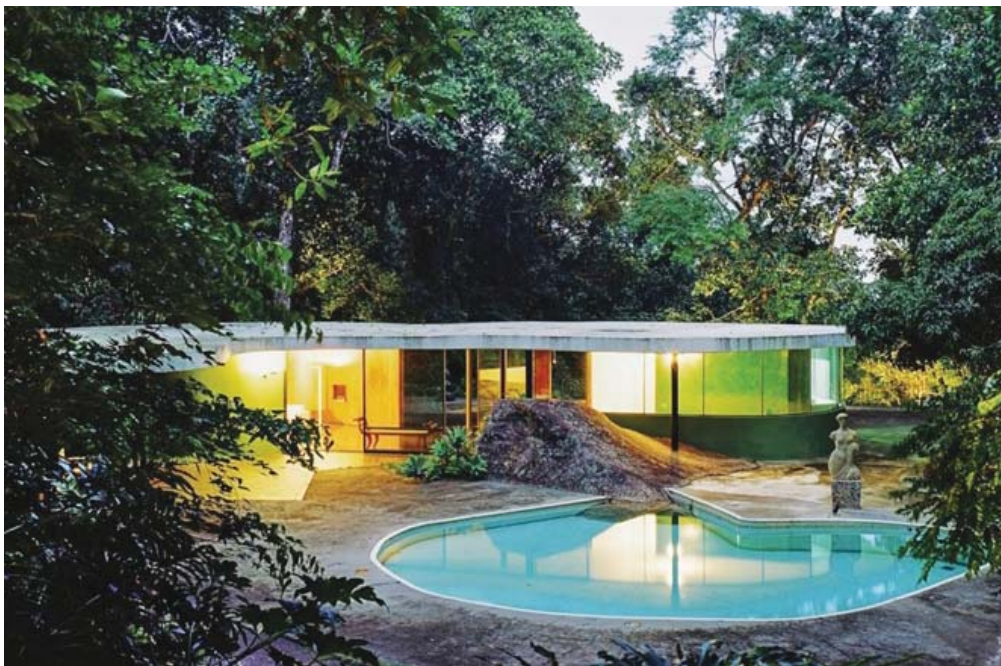
Рис. 4. Дом Оскара Нимейера

Пятилетний Курт в игре «обустроивал дом для одиночного владения», украшал и оснащал его, а дом обозначал мать (Кляйн, 2018, с. 144). Еще один мальчик постоянно изображал материнскую утробу через карту местности. Если все это в игре проделывают маленькие дети, то резонно предположить, что взрослые, имея гораздо больше возможностей, продолжают играть, создавая дом своей мечты и обустроивая его, пытаясь таким образом своими руками «слепить» идеальную материнскую утробу и место для формирования Идеала-Я.