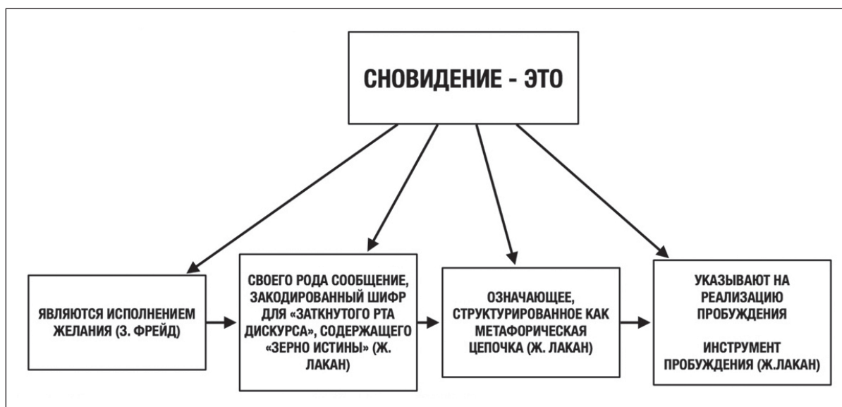
Рис. 1. Понимание сновидения у З. Фрейда и Ж. Лакана

Ж. Лакан в XIII семинаре «Объект психоанализа» ( L'objet de la psychanalyse , 1965–1966) утверждал, что ранние иероглифы в пещерных рисунках ведут обратно к логической матрице знака ( Dream, Its Interpretation... 2020). З. Фрейд никогда не мог выйти из воображаемых тупиков своего собственного открытия, утверждал Ж. Лакан, потому что он никогда не понимал, что свободная ассоциация функционирует по законам метафоры и метонимии, делая «психическое» влиянием бессознательного на соматическое. Другими словами, «вторичный процесс», или сознательная часть языка, метафора, – это исполнение желаний сновидения, дневной остаток, в то время как фантазии, по Ж. Лакану, не являются сновидениями или дневными желаниями. Фантазии – это «бессознательные организации субъективизации реальности». В то время как З. Фрейд говорил об исполнении желаний, Ж. Лакан говорит о форме мышления субъекта бессознательного ( Kovacevic , 2013). Когда фундаментальные элементы фантазма появляются в «сознательном» мышлении пациента, будь то проявленная мысль сновидения или литературный текст, эти элементы будут следовать законам знака, организующего язык вокруг желания. Ж. Лакан заходит так далеко, что предполагает, что работа «Толкование сновидений» З. Фрейда сделала возможным развитие формальной лингвистики. Но аргументы З. Фрейда были недостаточны для того, чтобы показать формирующую силу знака, т. е. проблему, которую лингвисты так и не решили.