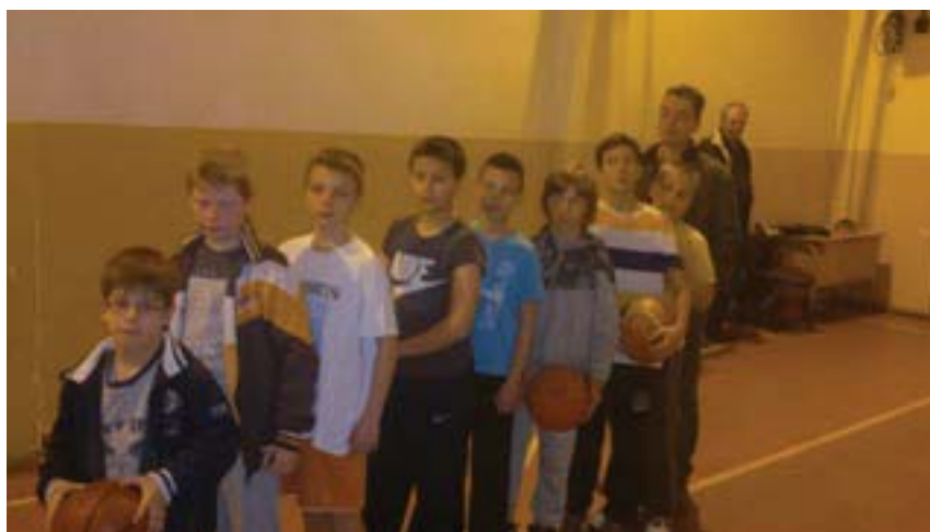
Рис. 3. Мальчики в спортзале

Как и всегда в нашей практике, тема для этой СФМ была выбрана в сотрудничестве с нашим сербским коллегой, спонсировавшим данное мероприятие. Мы работали с группой из 48 участников, но лишь половина из них прислала фотографии. Впоследствии мы узнали, что многим участникам семинара было трудно сделать фотографию, относящуюся к заданной теме. Например, участник, сделавший вышеприведенную фотографию (рис. 3), сказал, что ему было крайне затруднительно найти подходящий объект. В этой фотоматрице было много фотографий, взятых из личных архивов людей, например фотографии египетской статуи, дома знаменитого архитектора в Барселоне, чьей-то дочери, одетой в летнюю одежду (фото, которое нельзя было включить в матрицу, так как она