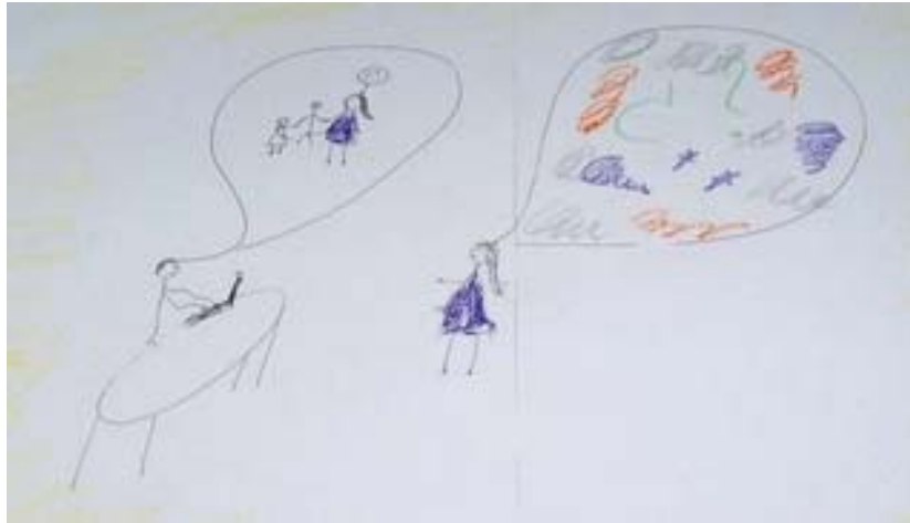
Рис. 7. Социальный рисунок сновидения «Позаботьтесь о моих детях»

достигать стабильности, иметь материальные активы и власть выше здорового уровня» (там же, с. 11). Крест, нарисованный на кровати, оказался важным элементом, который, вероятно, никогда не был бы раскрыт без рисунка. Это привело к ассоциации с ролью Фонда рыцарей-тамплиеров в Чили – благотворительной организации, которая в то время работала в детской больнице Сан-Хуан-де-Диаз в Сантьяго. Вопрос о том, насколько человек может или должен рисковать, как далеко он должен зайти, чтобы помочь другим, также связан с требованиями к самозанятому консультанту. Об этом было сказано на рефлексивной сессии: «Вы должны установить четкие пределы в отношении рисков. Тамплиеры, например, отдали свои жизни, но вам не нужно заходить так далеко» (там же, с. 12).