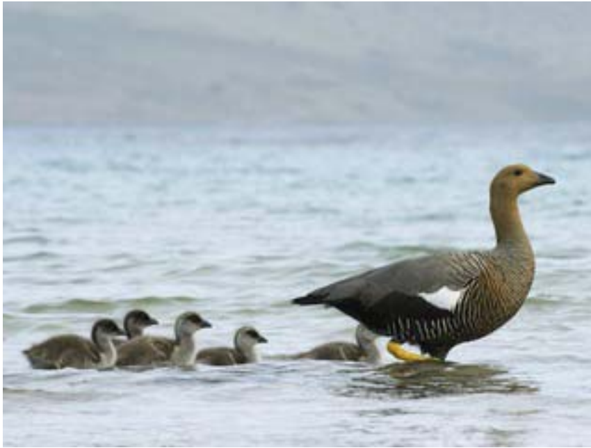
Рис. 4. Утка-мать и пятеро утят

проводилась в марте). Другие фотографии, казалось, были скопированы из интернета, например пять гусят, следующих за своей матерью (рис. 4).