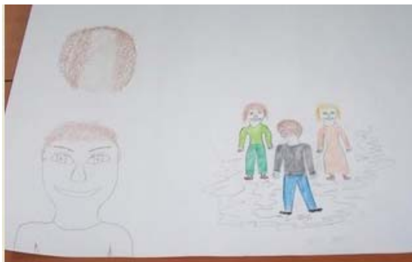
Рис. 5. Социальный рисунок сновидения «Отсутствие волос и студенты университета»

чувствами по отношению к студентам, которые подходят к нему после лекции. Ассоциации и рефлексия о том, как это быть обнаженным и выставленным напоказ, привели к обсуждению темы «маски как характеристика чилийского общества, в частности чилийской олигархии»: то есть когда возникает ощущение, что все носят маски, поскольку для выживания важно иметь определенное социальное и семейное происхождение, учиться в определенных университетах и т. д. Вы должны иметь то, что они называют «социальными полномочиями» (расшифровка социального рисунка сновидения, 2009, с. 8).