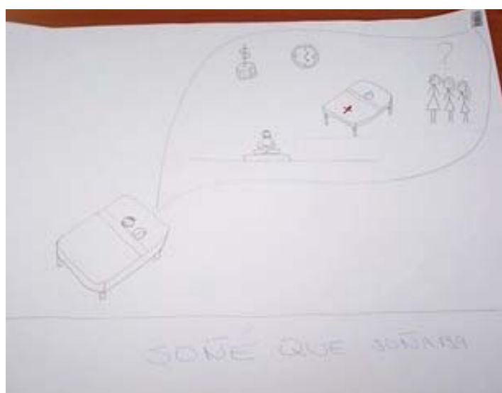
Рис. 6. Социальный рисунок сновидения «В больнице»

Этот рисунок самозанятого консультанта (рис. 6) отражает еще один вид беспокойства – страх заболеть и утратить способность содержать семью. Как выразился сновидец, «обязанность производить, создавать,