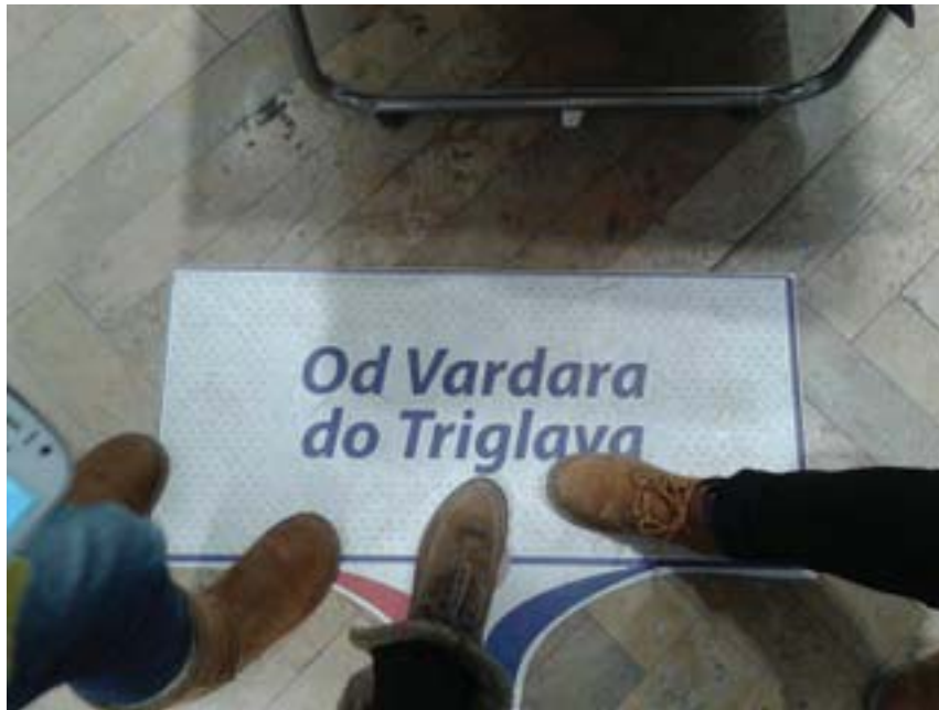
Рис. 1. «От Вардара до Триглава»

разные коннотации. Например, фотография «Упражнение на доверие в парке» (рис. 2), которая, по мнению Роуз, как американки, принимавшей участие в подобных упражнениях, могла бы сказать что-то положительное о лидерстве, вместо этого была довольно скептически и цинично проассоциирована участниками с сербской модой.