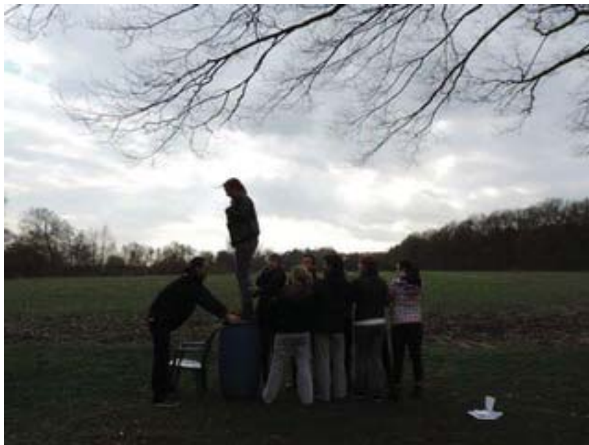
Рис. 2. «Упражнение на доверие в парке»

Этот опыт напомнил нам, что было бы ошибкой использовать социоаналитическую методологию как имеющую в основе единственную готовую